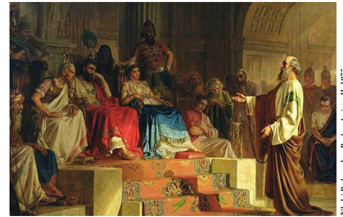
Nikolai Bodarevsky, Paolo e Agrippa II, 1875