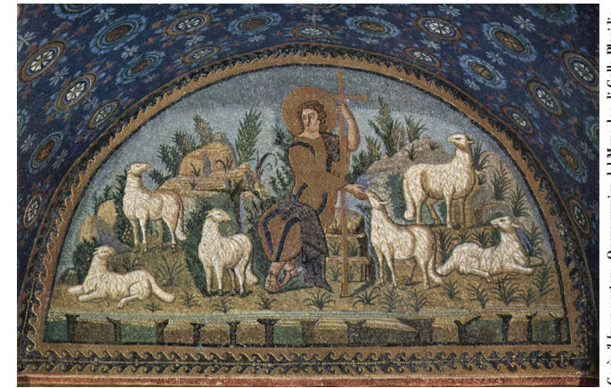
Gesù: il buon pastore. Opera musiva del Mansoleo di Galla Placidia, a Ravenna.